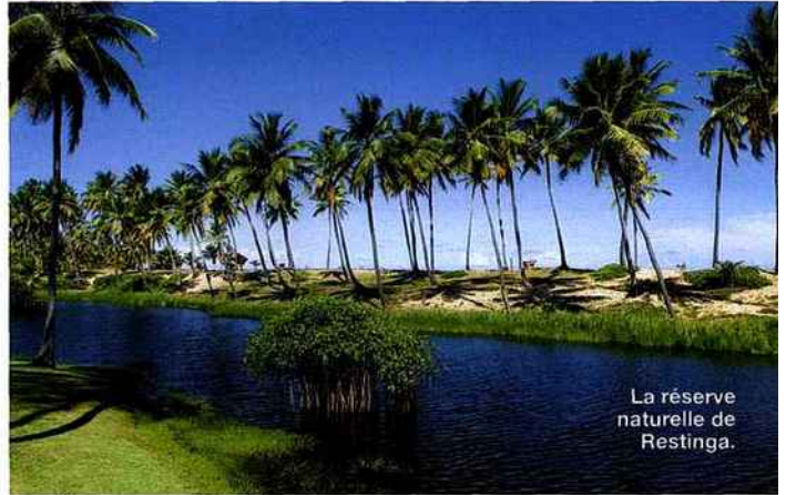
La réserve naturelle de Restinga.