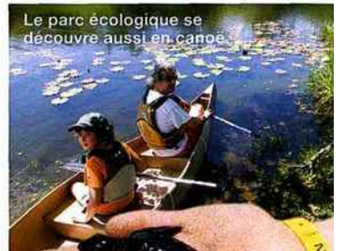
Le parc écologique se découvre aussi en canoë.