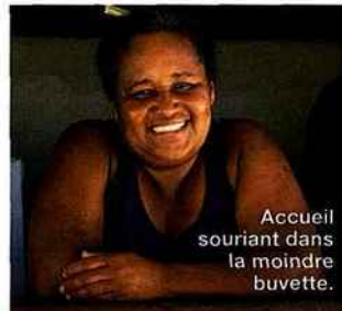
Accueil souriant dans la moindre buvette.