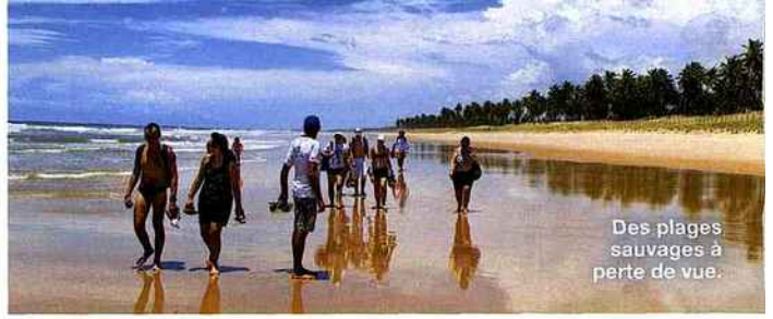
Des plages sauvages à perte de vue.